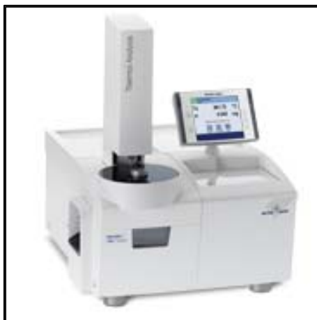
Figura 3: bilancia termogravimetrica della Mettler Toledo TGA/DSC 1

L'analisi sul carbone è stata effettuata con una bilancia termogravimetrica della Mettler Toledo modello TGA/DSC 1, presente presso i laboratori della sezione (figura 3)