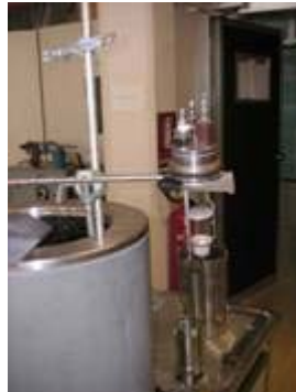
Figura 1: calorimetro di Berthelot Mahler

Il calorimetro è costituito da un vaso esterno cilindrico a doppia parete, nella cui intercapedine viene inserita dell'acqua a temperatura ambiente, che ha lo scopo di ridurre al minimo gli scambi di calore con l'esterno.